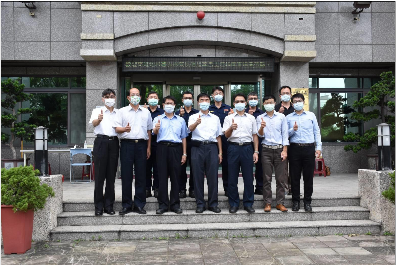
圖片說明：檢察長洪信旭率隊訪視三民第一分局。