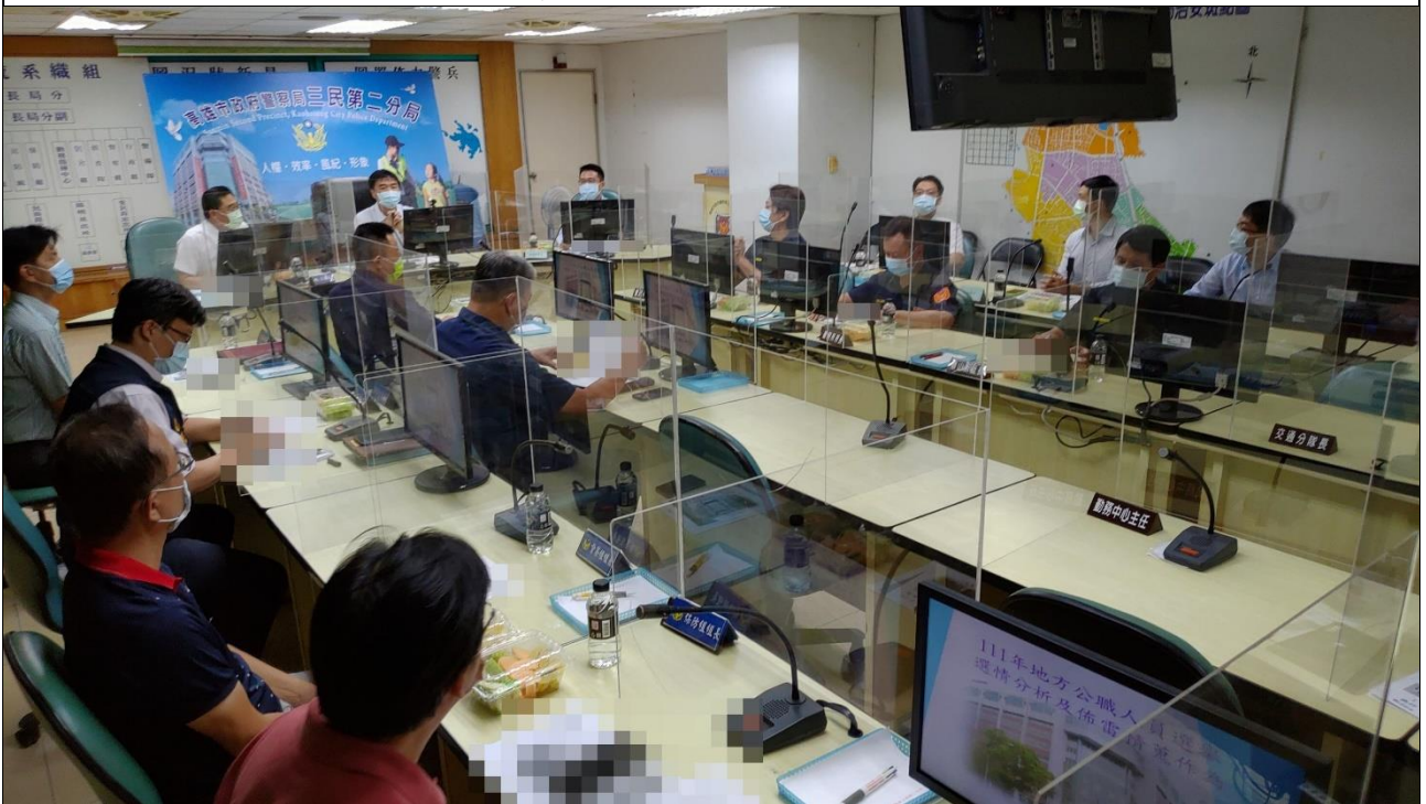
圖片說明：會議情形。