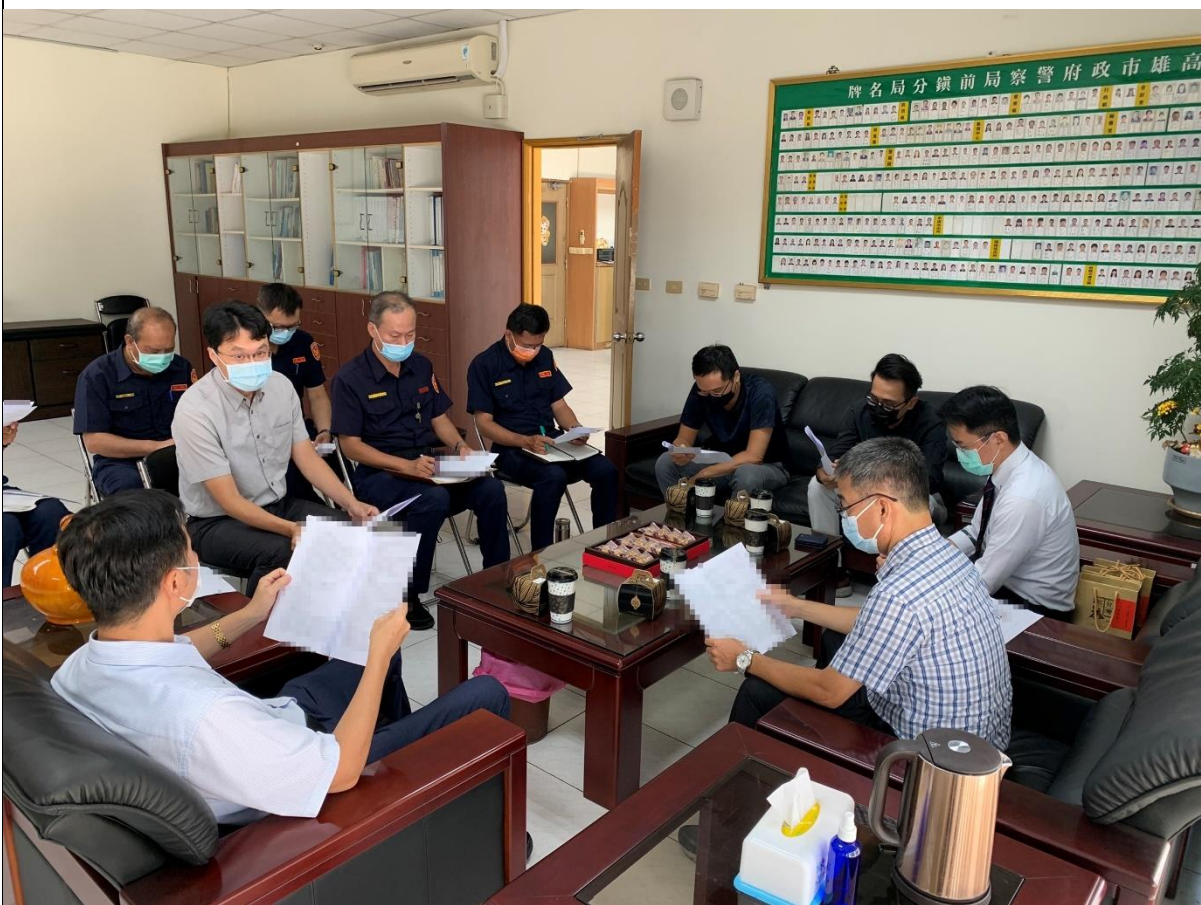
圖片說明：洪檢察長分析選舉情形。