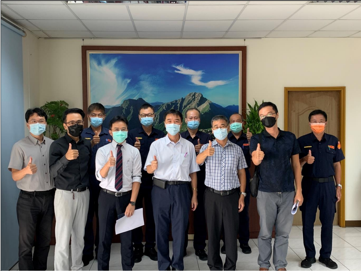
圖片說明：檢警共同合作打擊賄選、暴力之決心。