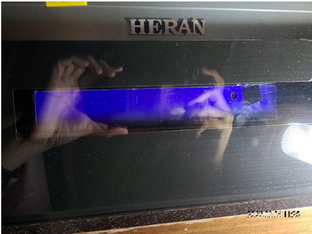
照片說明：黃姓被告將針孔攝影機裝設在房間之餐點送達提示盒