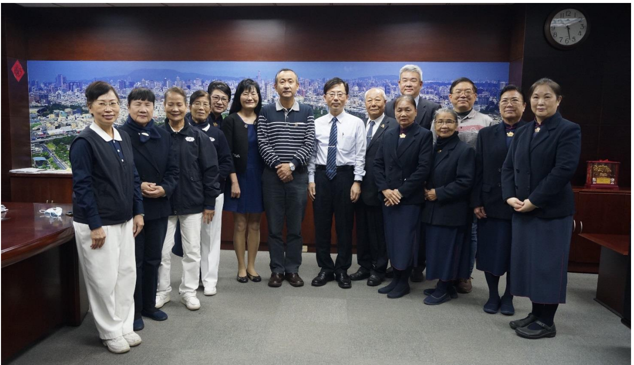
圖四【說明：檢察長莊榮松與兩大合作夥伴合影】