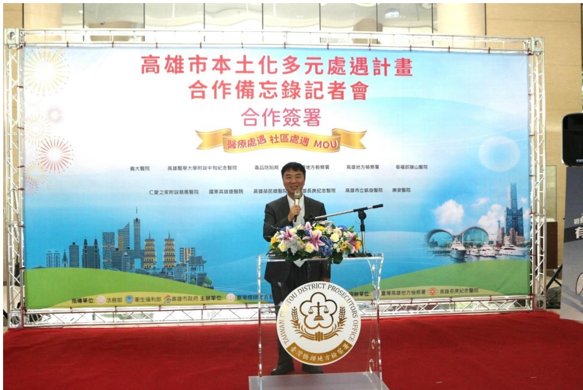
說明 1：檢察長洪信旭致詞

橋頭地檢署表示，毒品施用者對毒品的依賴性非一朝一夕可戒除，毒癮戒除亦非一舉而竟全功，為避免戒癮療程歸於徒勞，就必須透過檢、醫跨領域互助合作，才能讓有心戒毒個案能重新回到家庭、工作及社會當中。