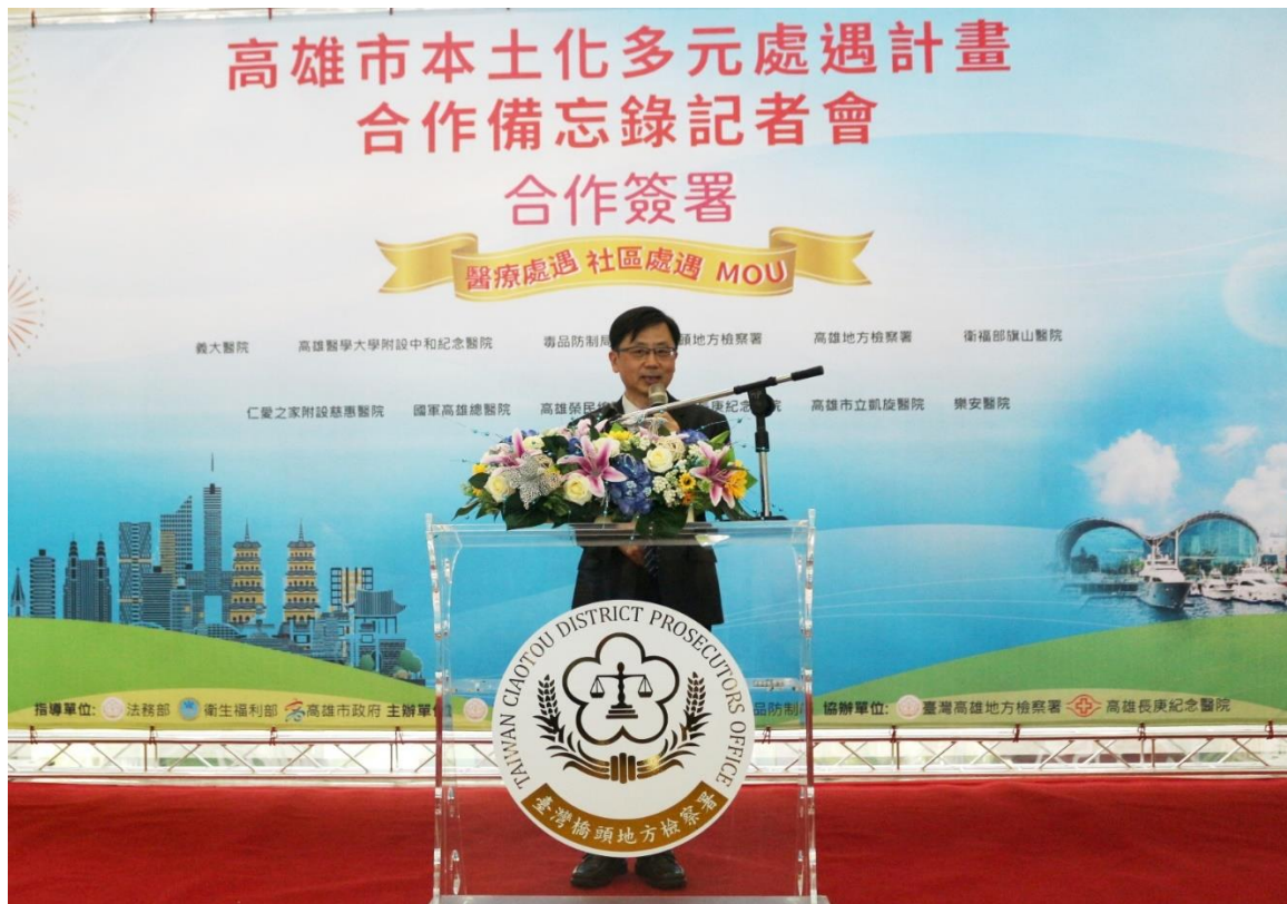
說明 2：檢察長莊榮松致詞