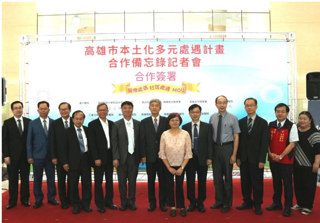
說明 4：與會來賓於備忘錄背板前合影