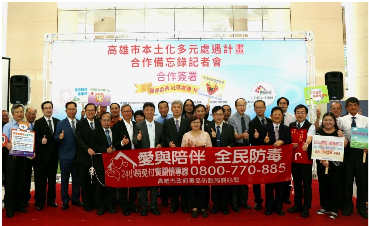
說明 5：與會來賓共同合照