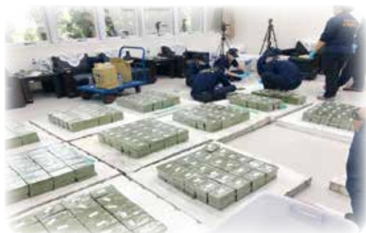
本案查獲之海洛因磚

船頂及後艙船頂扣得15個碰墊，發現每1碰墊內有黃色麻布袋2只，每1黃色麻布袋內有海洛因磚60塊，共計扣得1800塊海洛因磚（毛重約693公斤），為國內緝毒史上查獲量最高。