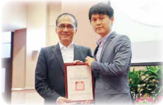
行政院林全院長表揚許育銓檢察官偵辦本案