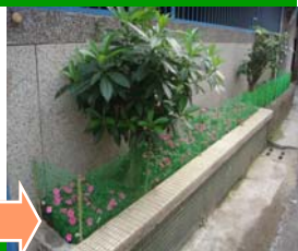
綠美化整理後情形