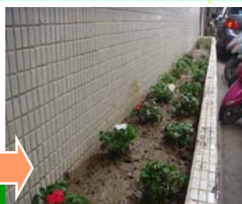
髒亂點整理後情形