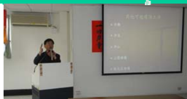
張議員為佐理員講解環保實務,並輔以實例探討現況。

於101年4月17日特聘請前環保署副署長、現任高雄市議員張豐藤,為觀護佐理員講授「環境保護實務」課程,特別介紹環保政策與易服社會勞動業務之實踐相關部分,並輔以實務案例探討,為觀護佐理員解答疑慮,使觀護佐理員能更加了解社會勞動運用在環境保護上之重要性。