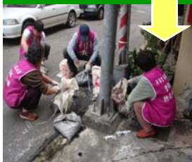
清疏後溝土處理清運