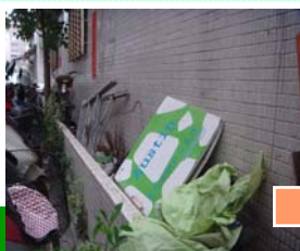
髒亂點整理前情形