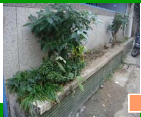
周邊綠美化整理前情形