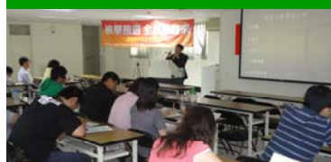
張議員針對社會勞動與環保議題提出自身看法及見解。