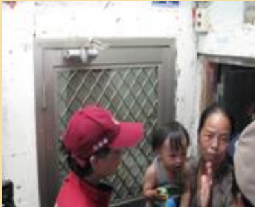
9月2日法務部長來訪潘婆婆，仍可見斑駁的牆面