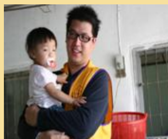
觀護志工協進會關懷受災戶