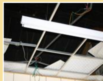
潘婆婆家的天花板殘破不堪