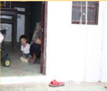
88服務隊為潘婆婆粉刷出煥然一新的住家