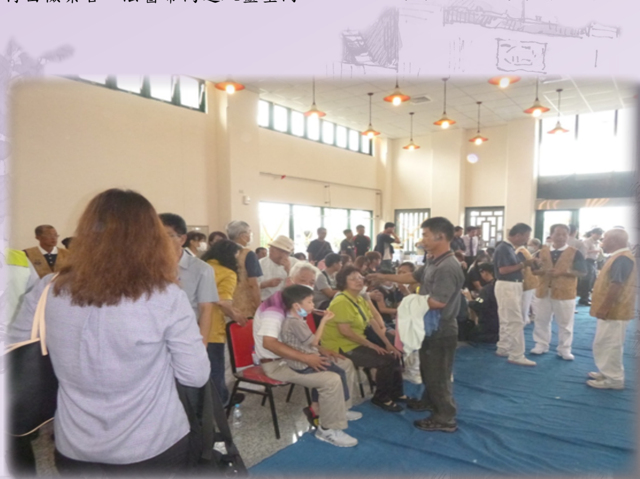
▲ 家屬休息區內部情形

到了約 9 時 30 分許，法務部法醫研究所潘至信法醫率法醫研究所之支援人力到場，沒過多久，內政部警政署刑事警察局程曉桂主任亦帶同刑事局之鑑識人員到場，程主任一到場即提供許多寶貴意見，法醫所潘法醫亦對相驗流程有所指示，為使相驗過程能順利進行，約於 10 時許，本人邀集潘法醫、程