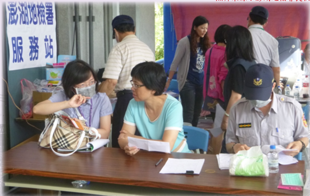
(澎湖地檢署服務站，圖中為郭珍妮檢察長親自在服務站內為民眾提供諮詢)