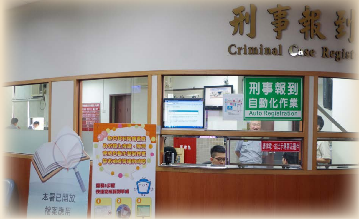
▲ 自動化開庭報到系統

(二) 偵查庭外設置綜合顯示看板以及庭外顯示器，提供庭訊的資訊：偵查庭外的綜合顯示看板使當事人以案號比對得知自己的案件排序，而庭外顯示器能即時提供開庭的資訊，使當事人得以清楚當前開庭進度。