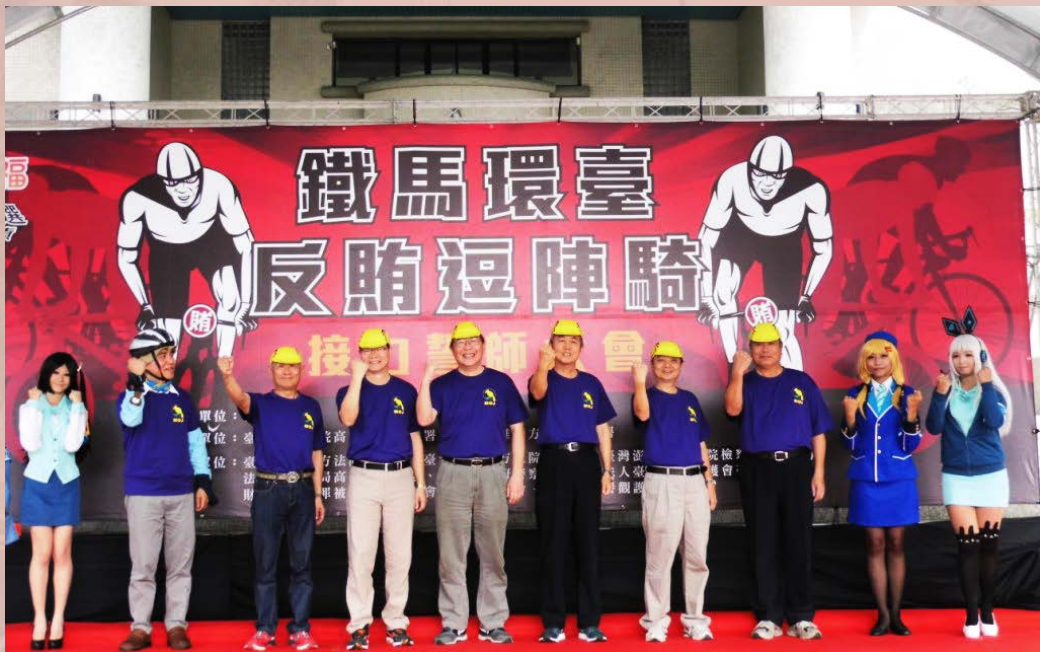
▲鐵馬環臺 - 反賄逗陣騎接力誓師大會

於104年12月15日舉辦「一戶一信封」記者會(150人)，另於選前透過2,260個警勤區，將1,077,550份「檢舉賄選專用信封」分送至各家戶，讓檢舉賄選變得輕而易舉。