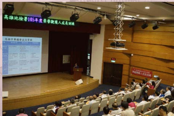
▲ 105 年度榮譽觀護人成長訓練課程

一種同步性平行開展在他們的成長與我們的尋求突破之中。我們不停地重新解構原有的工作內容與既有文化，試圖在框架與限制之中化解與創造。在全人的信念之中，完整是沒有分裂或相對的兩極，只有不斷浮現、流動、發展及變化的創造過程，帶著這份信念我們重整又連結地開啟了嶄新的觀護工作方向：