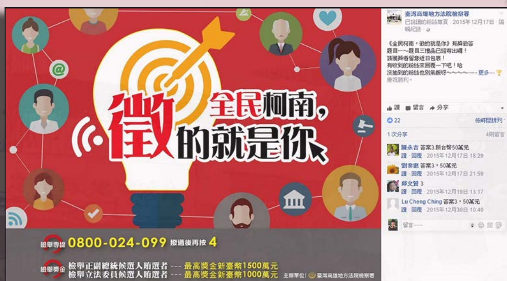
▲Facebook 粉絲專頁「全民柯南·徵的就是你」有獎徵答活動

因應網路資訊時代趨勢，除建置本署 Facebook 粉絲專頁並辦理有獎徵答活動外，藉由檢察長偕同檢察官拍攝之反賄宣傳及有獎徵答影片與網友頻繁互動。粉絲專頁點閱突破 26,000 人次，已觸及用戶數 136,095 人，並累計可參與抽最大獎 2,045 人，充分展現網路行銷「全民柯南」之成效！