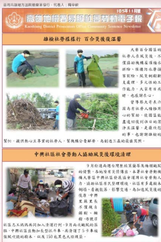
▲ 易服社會勞動電子報

本署社會勞動電子報每月份固定發行 1 次，發行方式以電子郵件發送予各社勞機構及其他相關單位，並以紙本張貼於本署各佈告欄。發送單位達 173 個，估算每期閱覽人次可達千人以上。