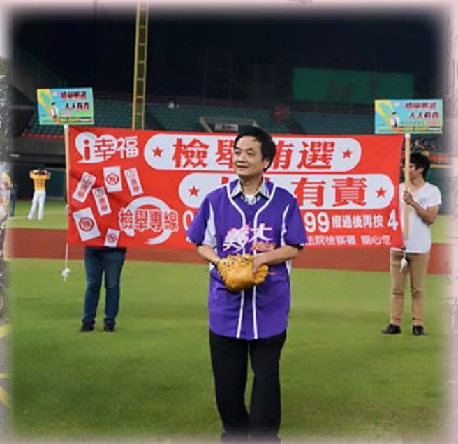
▲ 中職義大球團反賄活動周章欽檢察長擔任開球嘉賓