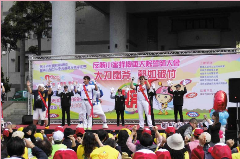
▲反賄小蜜蜂機車大隊誓師大會職棒啦啦隊表演