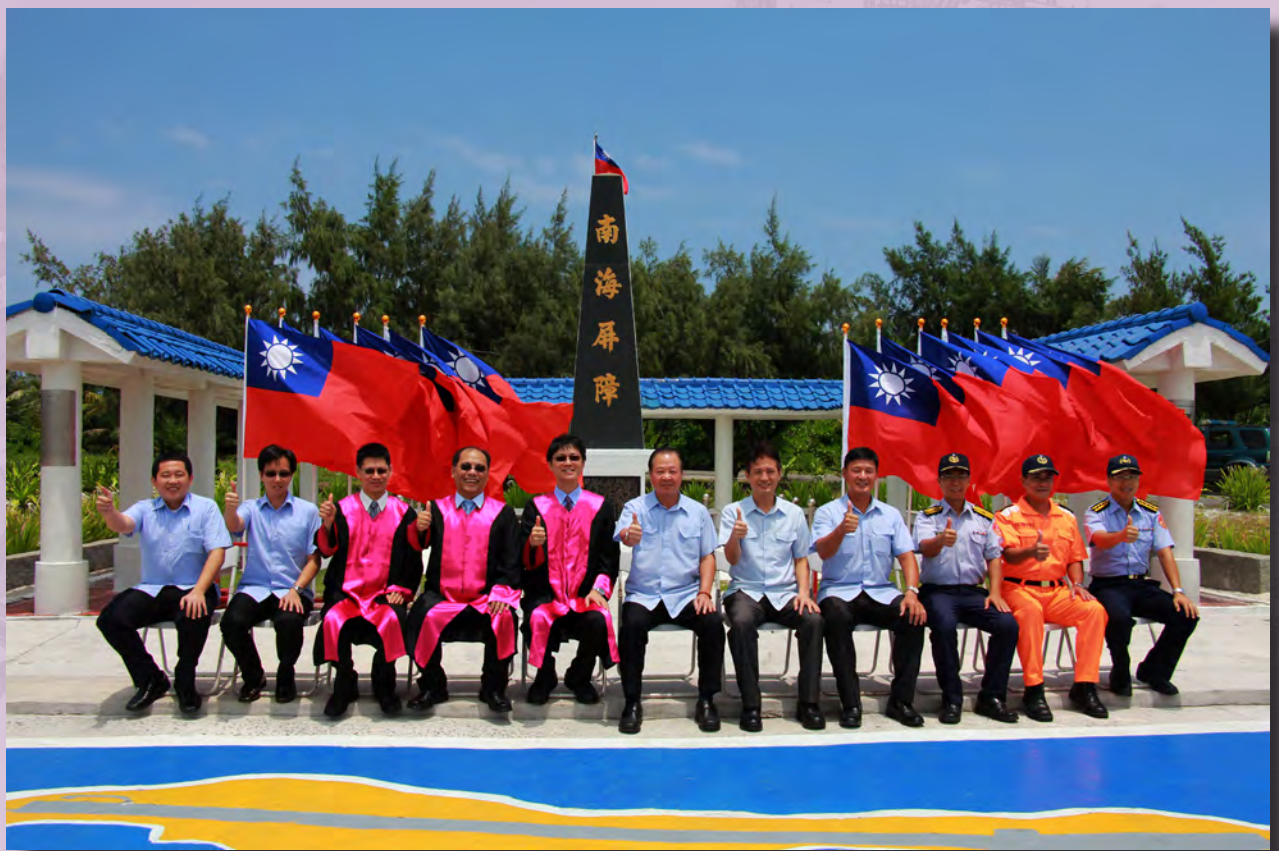
▲ 赴東沙島視察已設置完成的收容人犯留置處所及偵查庭預定位置

此次登島，在東沙大王廟前，眾人焚香祝禱，祈求四時無災、八節有慶，天賜鴻福、國運吉祥，南海太平、明珠恆光、海洋寶庫、生態永續。